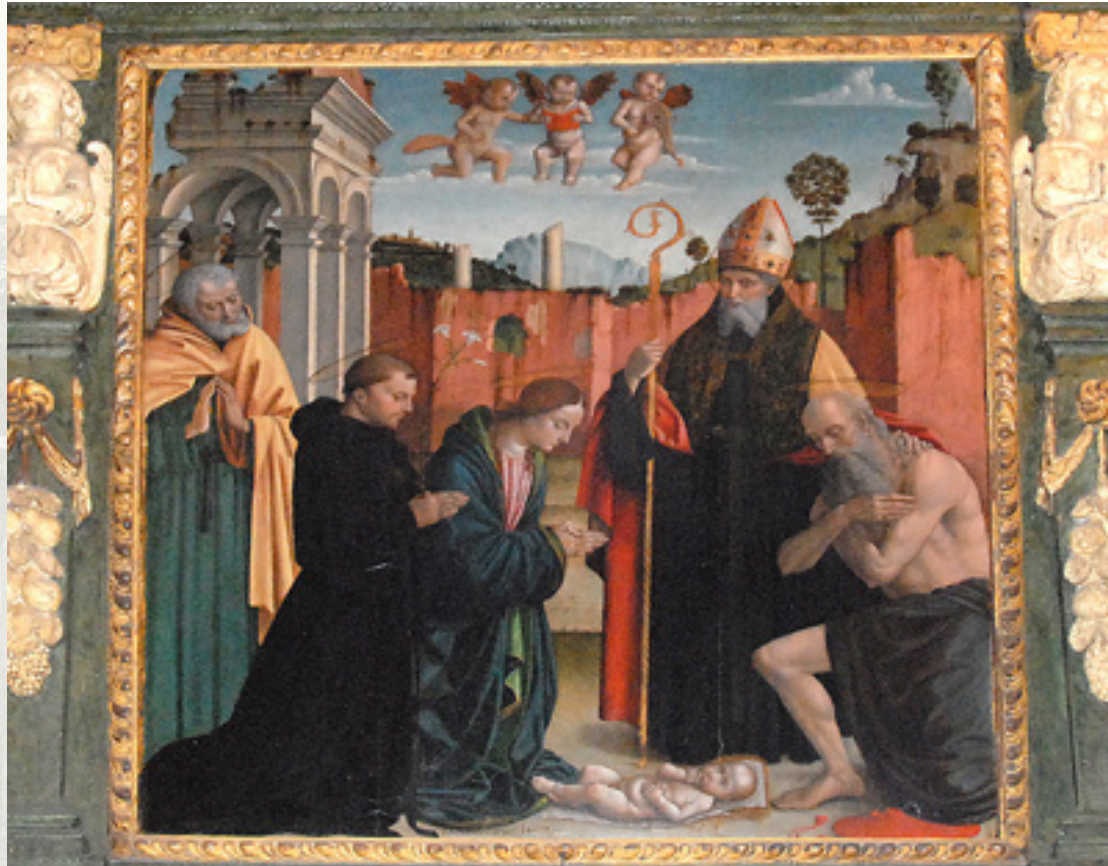
San Giovanni - Alba www.sangiovannialba.it